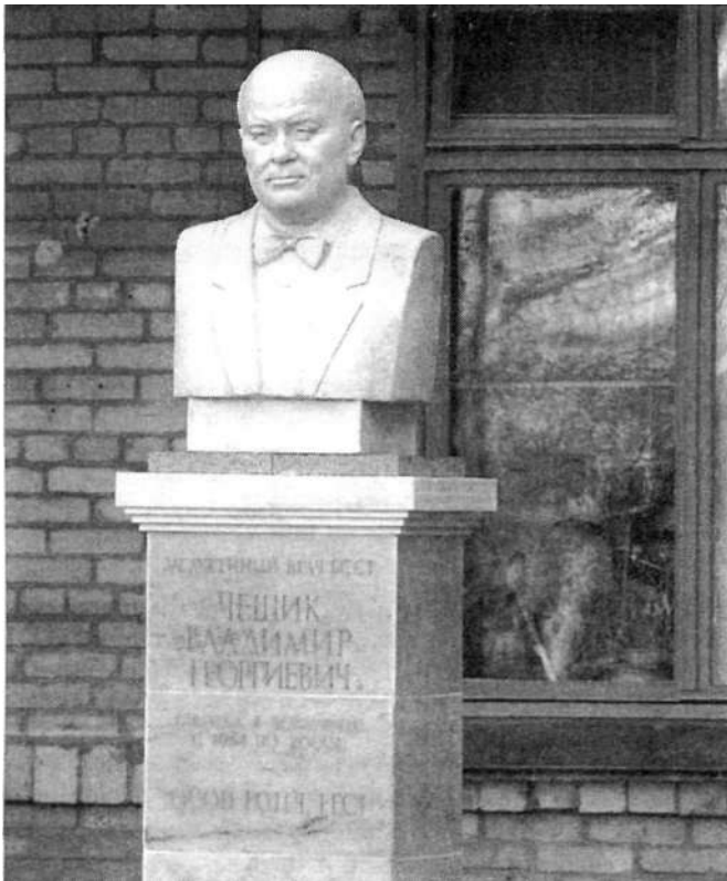
Мал. 3. Помнік Уладзіміру Георгіевічу Чэшыку

"Асаблівы прырытэт на міжнародных канферэнцыях у Маскве, Ленінградзе і іншых гарадах, — працягвае В. А. Мацукевіч, — ён аддаваў дакладам па таракальнай хірургіі, судзіннай хірургіі, сухотам, карбунцы лёгкага. Даказваў, што паслясухотныя шнары (рубцы) — гэта адзін з фактараў развіцця карбунцы лёгкага, распяваў пра асабісты вопыт па пластыцы дыхніцы і дыхнікаў, а таксама стрававода страўнікавай трубкай.