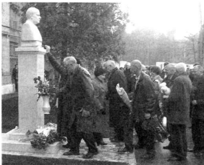
Мал. 2. Адкрыццё помніка У. Г. Чэшыку 4 лістапада 2005 года. Урачыстае ўскладанне кветак

Уладзімір Георгіевіч рэгулярна выступаў з дакладамі і дэманстрацыямі хворых на ўрачэбных з'ездах і пасяджэннях навуковых суполак, удзельнічаў ва Усесаюзных з'ездах хірургаў, у працы Сусветнага кангрэса трансфузіялагаў і Міжнароднага кангрэса хірургаў. У траўні 1962 г. Уладзімір Георгіевіч прымаў удзел ва "Усесаюзнай нарадзе па пытаннях хірургічнага лячэння лёгкіх сухотаў", якая праходзіла ў Маскве.